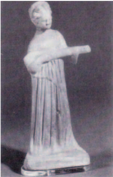
Εικόνα 1. Γυναίκα που παίζει πανδου- ρίδα. Πήλινο ειδώλιο από την Κύπρο. Τέλη 4 ου π.Χ. αιώνα.

Για τη μουσική στην Αρχαία Ελλάδα δεν ξέρουμε, δυστυχώς, τόσα πράγματα όσα ξέρουμε για άλλες τέχνες. Αυτό ισχύει βέβαια περισσότερο για παραδείγματα μουσικών κομματιών, που φυσικά δεν ήταν δυνατό να διασωθούν όπως διασώθηκαν ναοί, αγάλματα, ζωγραφισμένα αγγεία. Τα σωζόμενα γραπτά μουσικά κείμενα είναι ελάχιστα και δεν είμαστε και σίγουροι ότι τα αποδίδουμε όπως αποδίδονταν τότε.