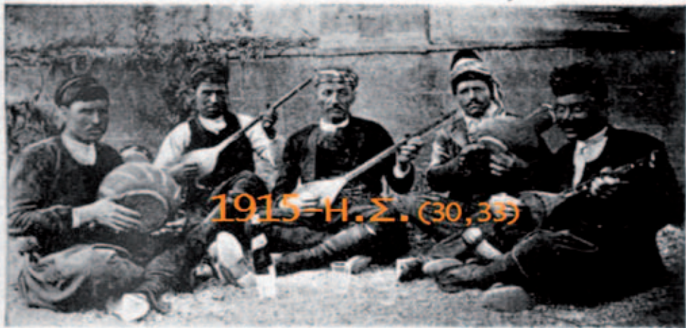
Σκίτσα από την Σμύρνην. — Σμυρναίοι όργανοπαίχται

συνεχώς σπανιότερα, μέχρι την πλήρη εξαφάνισή τους μετά τον δεύτερο Πόλεμο. Οι ντόπιοι τεχνίτες συνεχίζουν να αντιγράφουν τεχνικές και φόρμες των περισσότερο προχωρημένων συναδέλφων τους του εξωτερικού, εξετάζοντας αντίστοιχα εισαγόμενα όργανα και πειραματιζόμενοι. Στις προσπάθειές τους αυτές, βοηθούνται πλέον και από τους ίδιους τους πελάτες τους, που σταδιακά γίνονται όλο και πιο απαιτητικοί. Οι δούγες πληθαίνουν και η οπή στο καπάκι μεγαλώνει, αποβάλλοντας και την παραδοσιακή ροζέτα, σε μία συνεχή προσπάθεια για καλύτερο και λαμπερότερο ήχο. Το μέγεθος του ηχείου μεγαλώνει επίσης. Αλλά το όργανο παραμένει χαρακτηριστικό της λαϊκής κοινωνίας που το γέννησε και το εξέθρεψε, εκφράζοντας μαζί με το μπαγλαμά, το τζουρά και το κιθαρόνι τα αισθήματα και τις συνήθειες των ανθρώπων αυτών. Οι ντόπιοι τεχνίτες συνεχίζουν να αντιγράφουν τεχνικές και φόρμες των περισσότερο προχωρημένων συναδέλφων τους του εξωτερικού, εξετάζοντας αντίστοιχα εισαγόμενα όργανα και πειραματιζόμενοι.