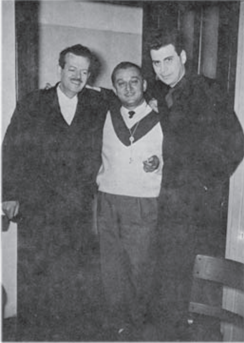
Ο Βασίλης Τσιτσάνης, ο Μανώλης Χαϊνός, ο Μίσης Θεοδωράκης (1959)

ηχογραφείται η δουλειά του Θεοδωράκη επιτάφιος, σε στίχους Ρίτσου και κομπανίες αρχίζουν να ξανά-ηχογραφούν ρεμπέτικα. Το 1968 ο Ηλίας Πετρόπουλος γράφει και δημοσιεύει το πρώτο βιβλίο για τα «ρεμπέτικα τραγούδια».